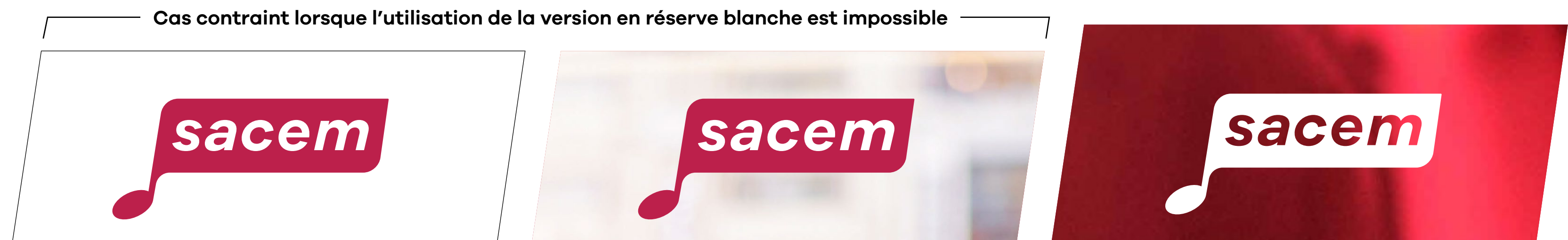
Application sur fond blanc