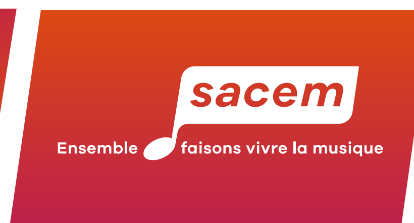
Application sur les 3 dégradés secondaires