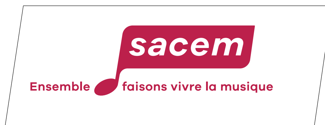
Application sur fond blanc

Cas contraint lorsque l'utilisation de la version en réserve blanche est impossible