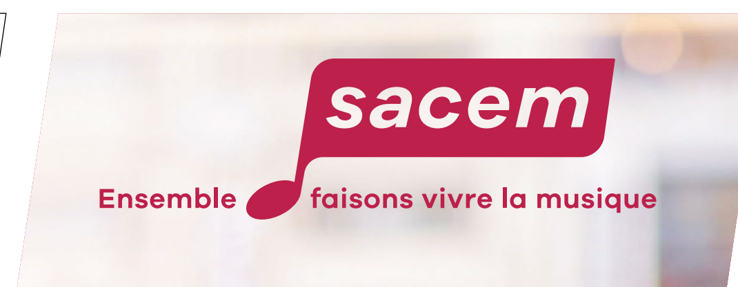
Application sur fond photo clair