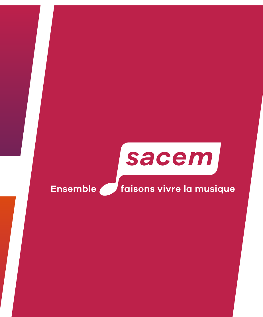
Application sur fond Pantone 7426 C