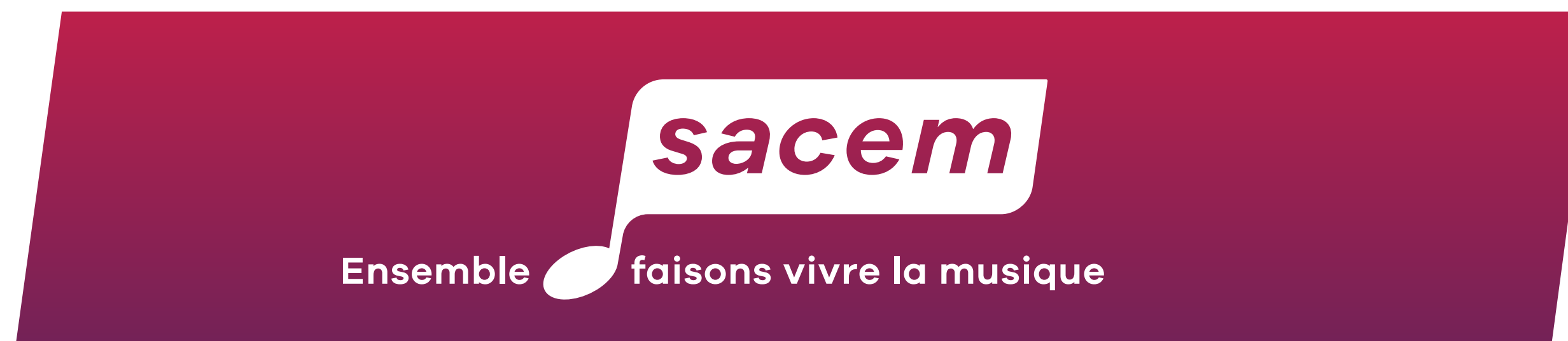
Application sur le dégradé institutionnel, à utiliser en priorité

Il faut toujours prioriser la lisibilité du logotype.