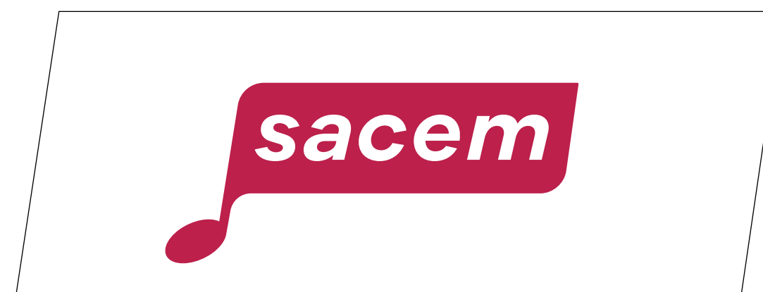
Application sur fond blanc

Cas contraint lorsque l'utilisation de la version en réserve blanche est impossible