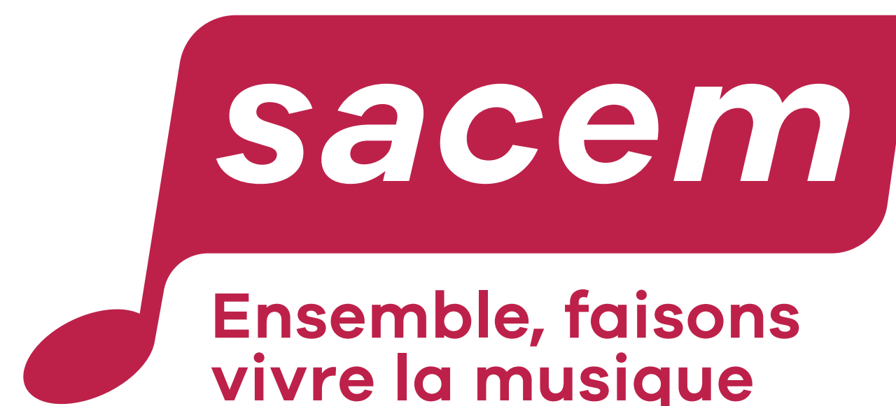
Logotype signature version 2 lignes (version pour espace étroit et co-branding)