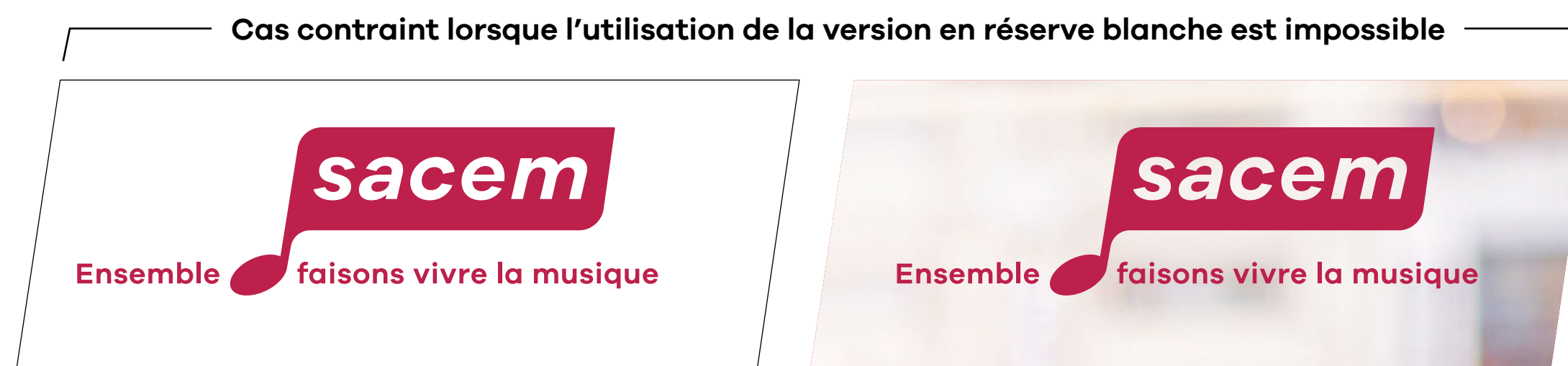
Application sur fond blanc