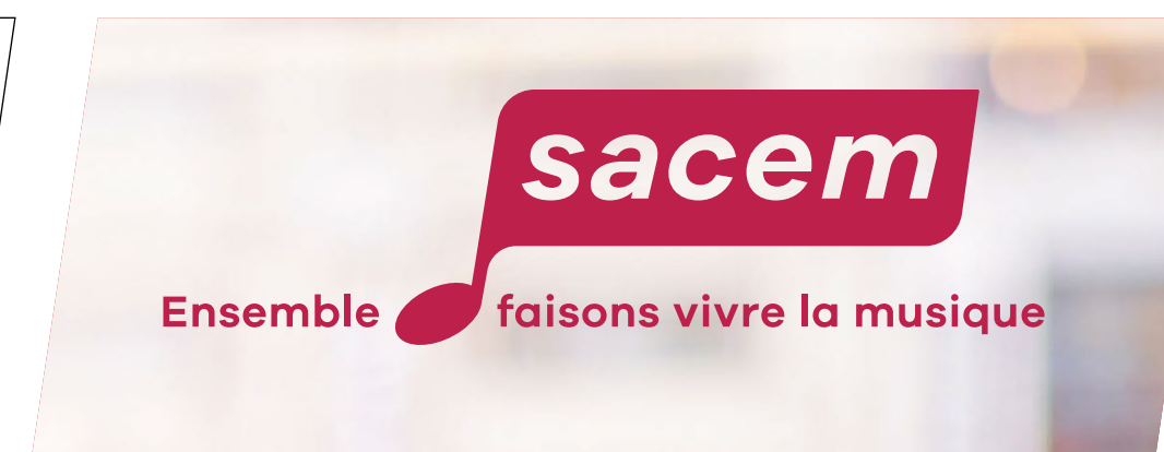
Application sur fond photo clair