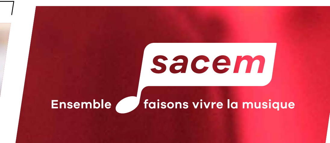
Application sur fond photo foncé