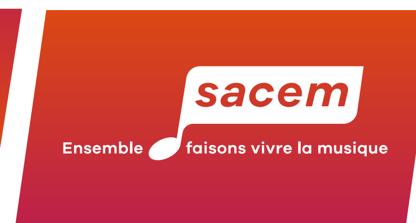
Application sur les 3 dégradés secondaires